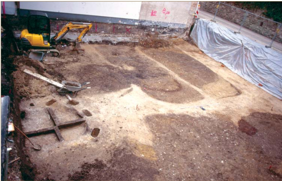
Abb. 1: Paderborn, Spitalmauer 10, Übersichtsfoto der Ausgrabung.

Im Dezember 2000 griff ein Bagger auf dem Grundstück Spitalmauer 10 tief in den Boden ein. Archäologen im Museum in der Kaiserpfalz beobachteten dunkle Verfärbungen, die sie als Reste alter Siedlungsspuren erkannten (Abb. 1 u. 2). In einer zweiwöchigen Rettungsaktion dokumentierte ein kleines Grabungsteam unter der Leitung von Dr. Pernille Kruse die menschlichen Hinterlassenschaften aus dem Mittelalter am Rande der Paderborner Altstadt. Es sind Reste eines Hauses und einer Werkstatt, die uns Einblicke in die Siedlung an der Pader geben. Dieser Ort existierte bereits, bevor ihn Karl der Große zu einem Mittelpunkt der Region ausbaute. Darüber hinaus entdeckte das Grabungsteam Gruben des 17./18. Jahrhunderts, die sehr wahrscheinlich von Gerbern stammen, die hier am Rande der Stadt ihrem die Nase beleidigenden Handwerk nachgingen.