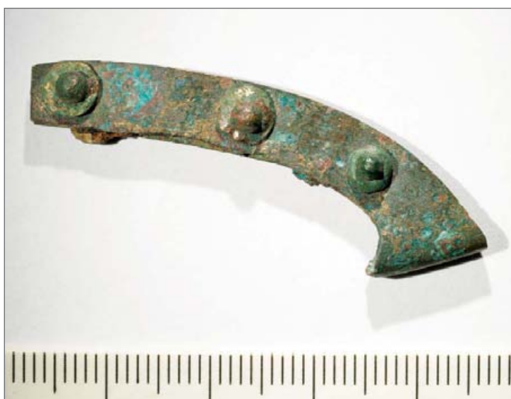
Abb. 4: Paderborn, Spitalmauer 10, Ortband einer Messerscheide mit vergoldeten Nietköpfen.

diesem Grubenhaus gemacht wurde, gibt es nicht. Häufig können solche Gebäude aufgrund von Standspuren eines Webstuhles oder Funden tönerner Webgewichte als Webhütten angesprochen werden. In der Hausverfüllung fanden sich einige knapp handtellergröße, charakteristische Schmiedeschlacken mit einer konvexen Unterseite und einer geraden bis konkaven Oberseite. Eine abgeflachte Seite markiert den Ansatz an der Esse. Da die Schlacken nach der Aufgabe des Hauses in die Verfüllung gelangten, stehen sie in keinem direkten Zusammenhang mit ihm. Sie geben uns aber darüber Auskunft, dass sich auf dem Hof auch eine Schmiede befand.